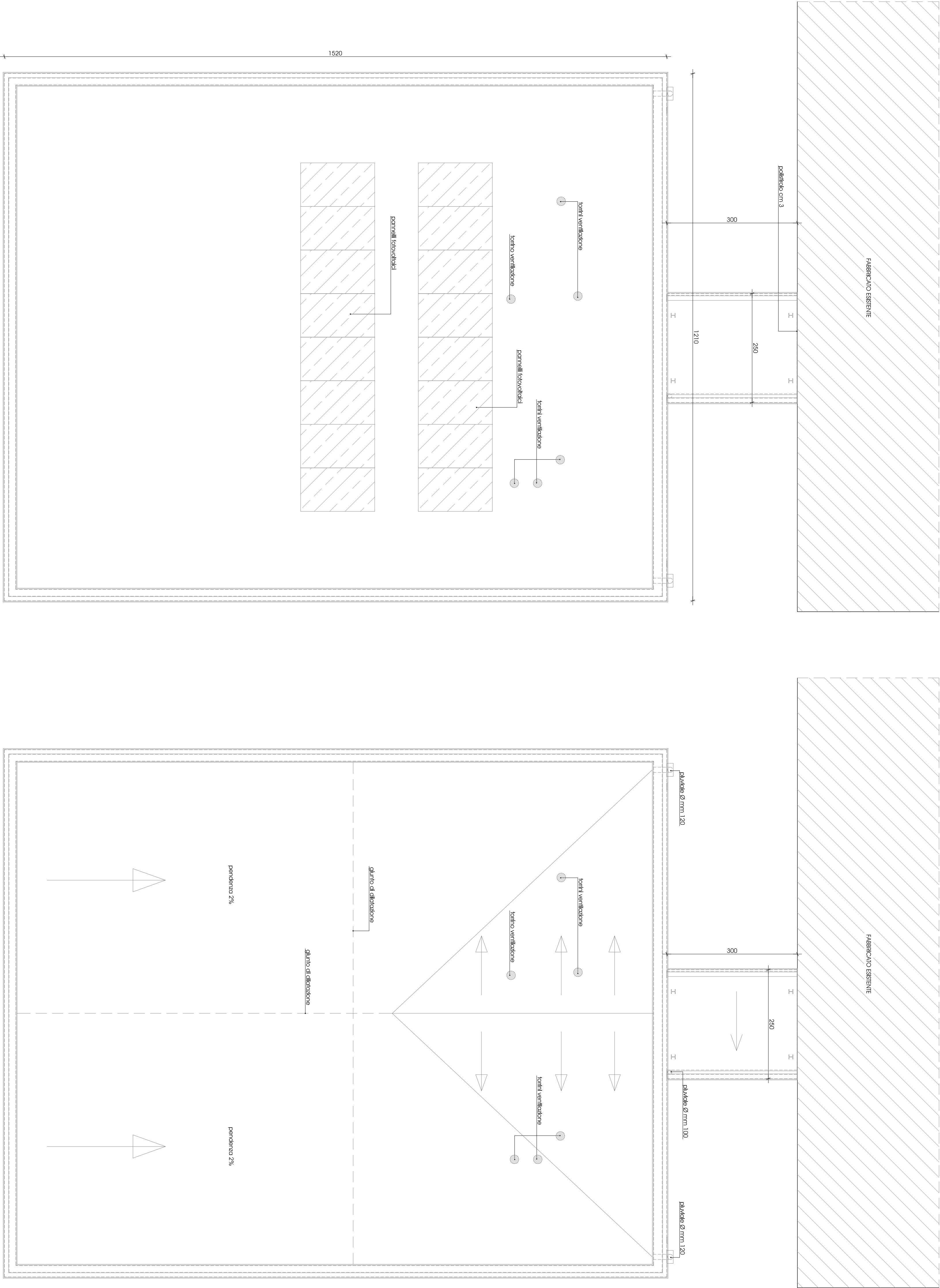
INDICAZIONE POSIZIONE PANNELLI FOTOVOLTAICI